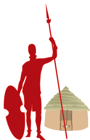
マサイ族と牛フンの家

遙か400万年前に人類の祖先はアフリカに誕生した。進化により体毛を失った人類はおよそ6万年前に森の記憶を携えて食糧と安住の地を求め、アフリカから世界へと旅立った。人類は様々な文化を創造し今日の繁栄を築いたが、常に森の記憶をその遺伝子の中に宿して来た。過酷な条件下でホモ・サピエンスは脳を進化させ、森の記憶を自らの住居に実現させた。現代文明は人類の森の記憶の伝承から生まれた。 人類が体毛を失った理由には諸説ありますが、一説には、現代でも狩猟採取を続けているアフリカ原住民の狩りに見いだすことが出来ます。それは獲物が走れなくなるまでどこまでも、獲物の後を追い続ける狩猟方法です。マラソンで42Km以上もノンストップで走り続けられる動物は人間しかいません。馬でも20kmノンストップで走らせると死にます。動物の多くは短距離ランナーで人間に追われ続けると、逃げ切ることは出来ません。その違いは汗線があるか無いかの違いです。人間は汗腺が発達し、発汗のために邪魔になった体毛を進化の過程で失ったという説もあります。動物では馬だけがまともに汗をかきます。最強の人類といわれるマサイ族*のように、肉体的に優れた人類はアフリカに残り、狩猟採取を続けましたが、生存競争に敗れた人類はおよそ6万年前にアフリカを旅立ち、中東・ユーラシア大陸を經由して世界中に拡散して行きました。アフリカを離れた人類は防寒や食料の調達など、生きるために様々な工夫が必要となり衣服を着用し、牧畜や農耕などを発明して現代文明を創り上げたのです。アフリカに残った人類は、生活を変える必要もなくアフリカで、つい最近まで狩猟採取の生活を続ける事が出来たのです。